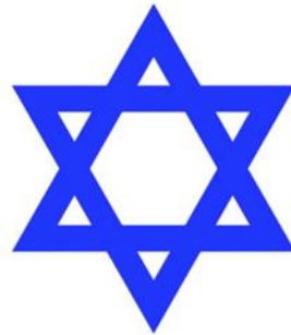
Estrella de David