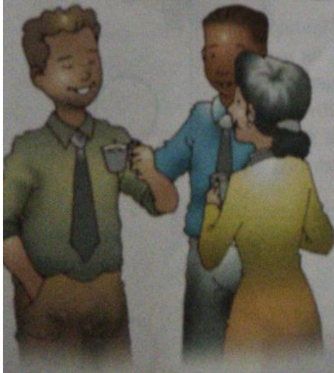
Ilustración 5.17: Existen momentos para el trabajo.

Momentos sociales: estos momentos son destinados para la vida social y nos permiten compartir con nuestros familiares y nuestras amistades.