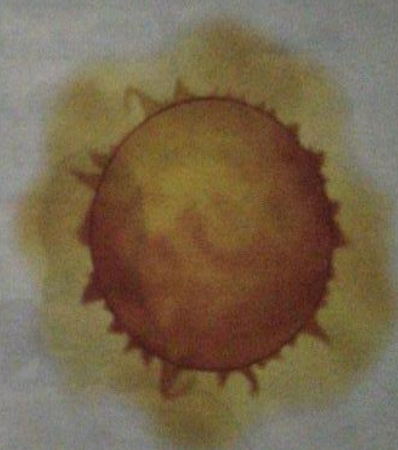
Ilustración 5.14 : El Sol es fundamental para la vida.